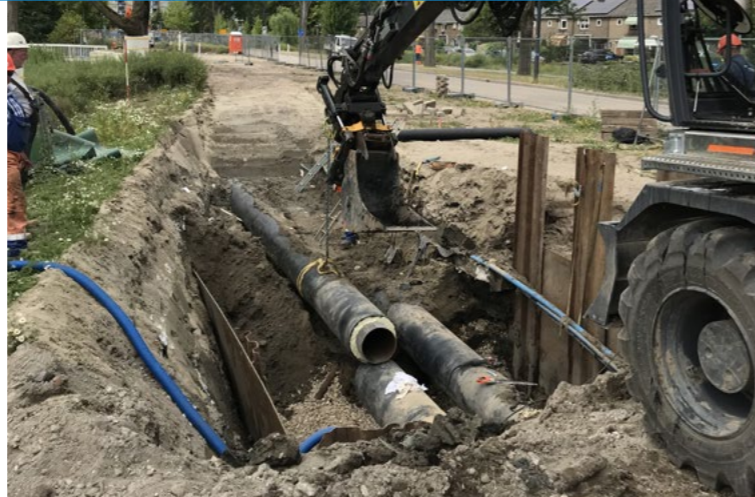
Eneco werkt nu aan het hoofdwarmtenet. De planning voor het secundaire net is in de maak. Dit zijn de kleinere buizen die vanaf het hoofdwarmtenet van en naar de huizen lopen.

Na de zomer legt Eneco de leidingen aan in de Obrechtstraat, Valeriusstraat, Willem Andriessenlaan en de Toon Verheystraat. In 2024 gaat het werk verder in de Borodinlaan bij de kruising met de Vivaldilaan en Laan van Bol'Es.